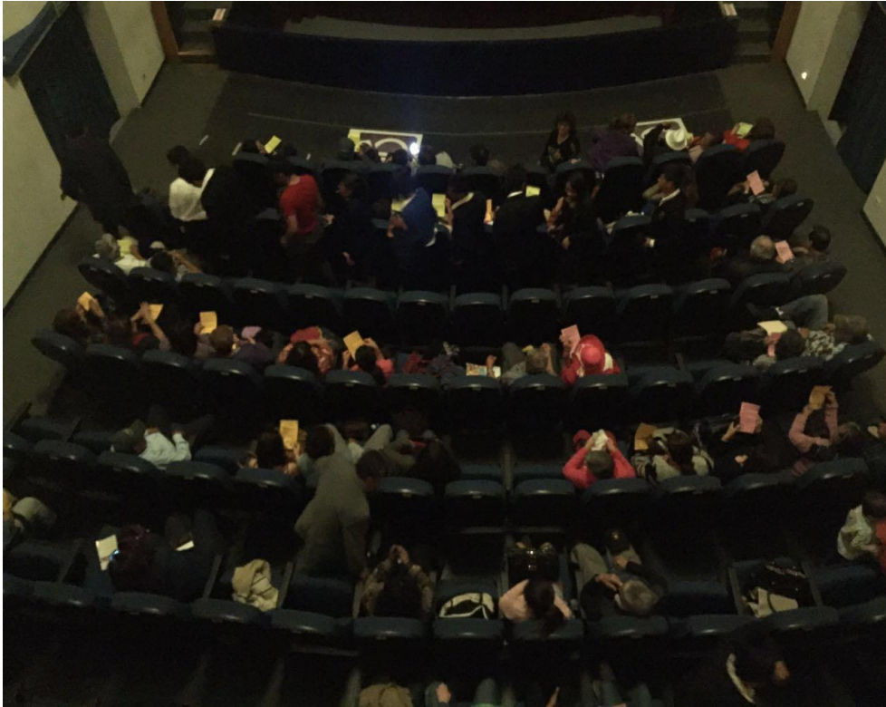
Entrando el público. EL MELODRAMA. Teatro de la ciudad, Puebla 2016