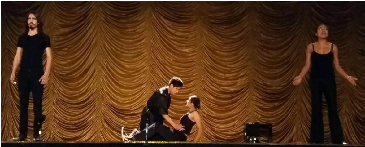
Escena 2. Teatro de la ciudad, Puebla 2016