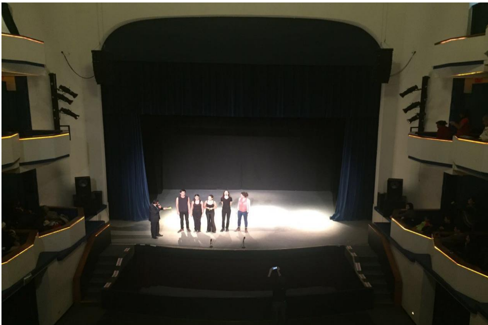
Saludando. EL MELODRAMA. Teatro de la ciudad, Puebla 2016