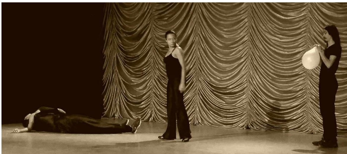
Escena 5. Teatro de la ciudad, Puebla 2016